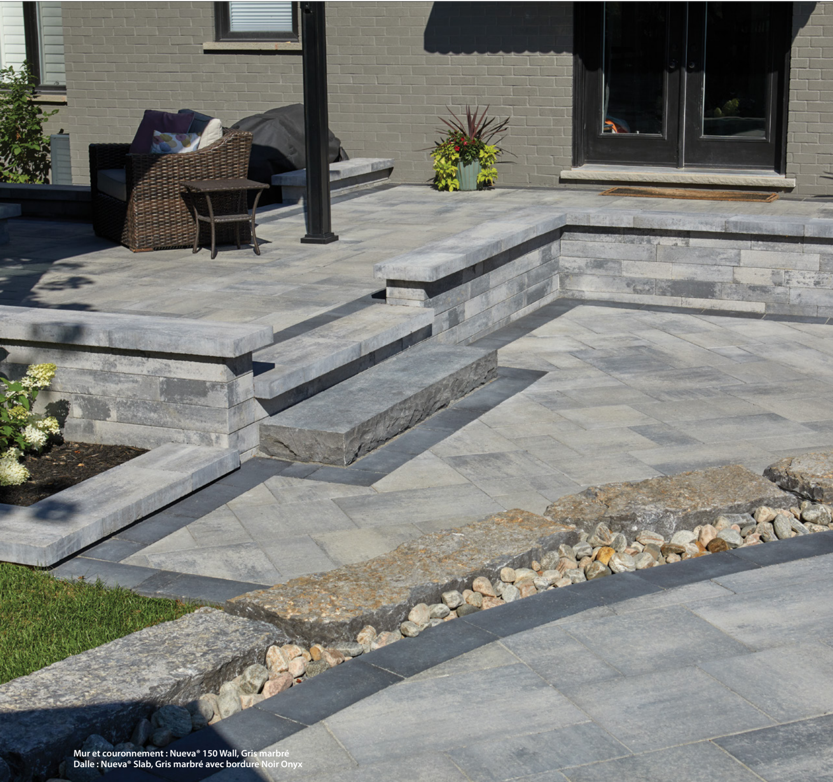
Mur et couronnement : Nueva® 150 Wall, Gris marbré Dalle : Nueva® Slab, Gris marbré avec bordure Noir Onyx

De nos jours, les tendances en matière de conception extérieure font appel à des lignes épurées, un style contemporain et une palette de couleurs bien agencées. Le muret Nueva® 150 est conçu avec la polyvalence et la force requises pour aider les propriétaires de résidence et les concepteurs professionnels à accroître l'espace utilisable en adaptant les dénivellations problématiques, grâce à un profil effilé et une surface lisse des deux côtés. Grâce à la technologie brevetée M-Lock d'Oaks et à la conception à centre creux, le muret Nueva® 150 permet l'utilisation de remblai stabilisé pour assurer une stabilité optimale dans les applications les plus exigeantes et parfaitement verticales.